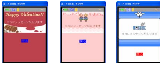
デコメールテンプレート一例

提供デコメールテンプレートを23種類から約100種類へと大幅に増量いたしました。